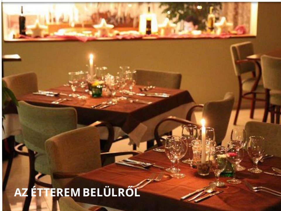
AZ ÉTTEREM BELÜLRŐL