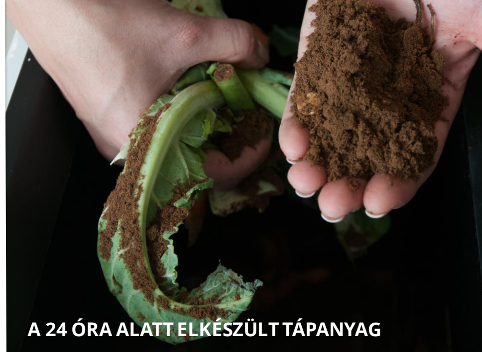
A 24 ÓRA ALATT ELKÉSZÜLT TÁPANYAG