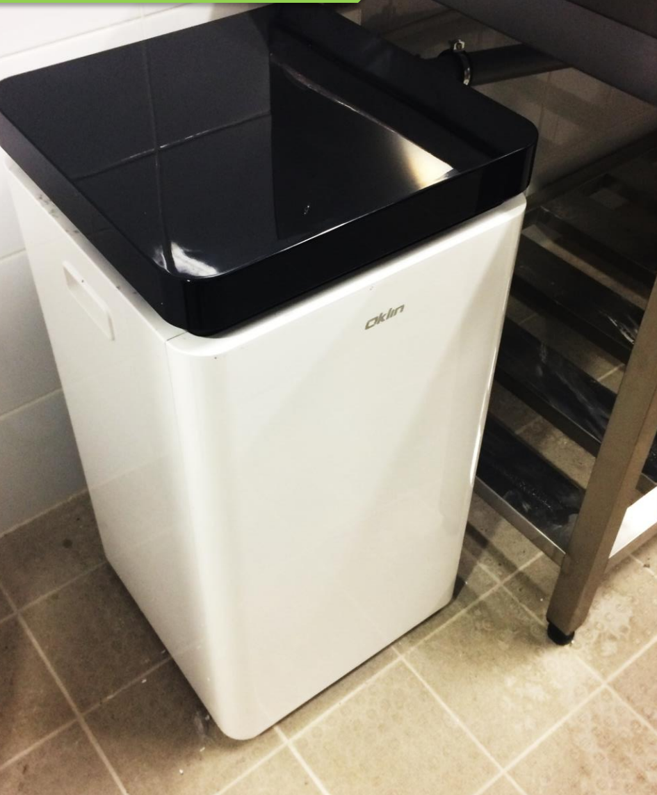
GG-02 KOMPOSZTÁLÓ A KONYHÁBAN